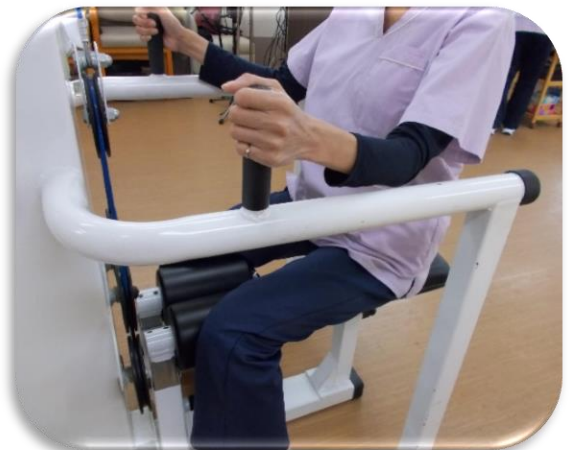
ヒップアブダクション

有酸素運動により新陳代謝をよくし、心肺機能を高めることを目的としています。 車椅子利用の方でも運動が可能です！