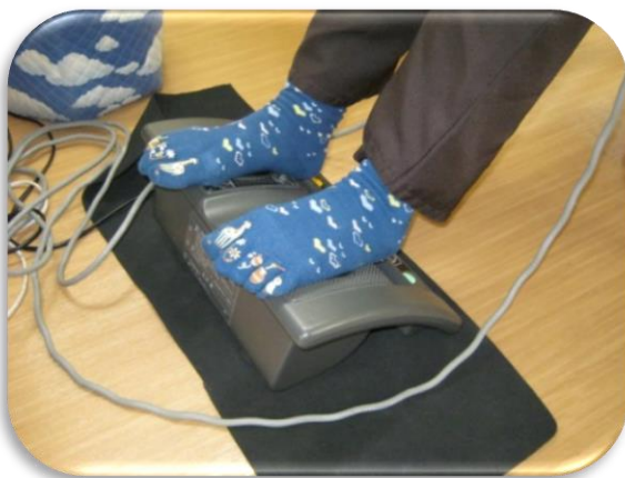
フットマッサージャー

振動による刺激で、フットマッサージャーは足裏とふくらはぎが、バイターは全身が温められることで疲れを癒します。干渉派では電気を流し、筋肉をほぐすことができます。